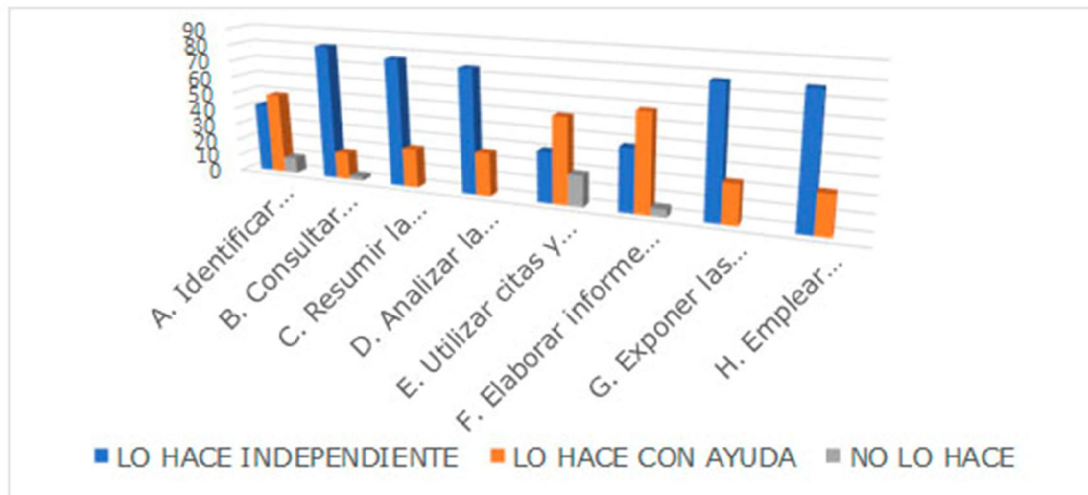
Fig. 1. Percepción del dominio de la habilidad para el manejo de la información científica