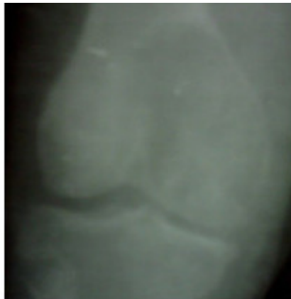
Fig.1. Lesión osteolítica cóndilo femoral interno.