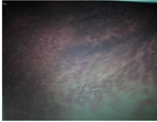
Fig. 1. Pigmentación marrón-oscura, atigrada del colon.