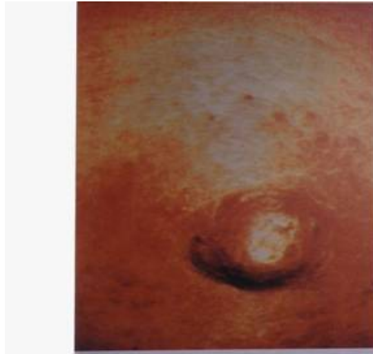
Foto No. 3 -Ulceración del pezón. Una biopsia de la lesión demostró células de Paget en la dermis.

La E.P se presenta después de los 45 ó 50 años y la duración de los síntomas es de unos 3 años. Casi siempre la primera manifestación se observa en el pezón precediendo a la aparición definitiva del tumor en la mama .Hay dos formas clínicas: La eczematosa y la ulcerativa (Foto No. 3 ).