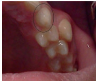
Fig. 1. Presencia del canino temporal izquierdo.

Al examen clínico bucal se observó presencia del 63 (Fig. 1), resto radicular del 11, fractura complicada del 21 (Fig. 2); transposición del diente 13 con el 14, que se ubica rotado (Fig. 3) y transposición del 23 con el 24. (Fig. 4)