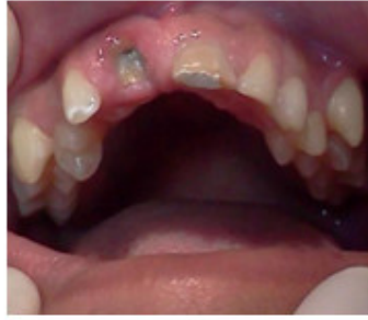
Fig. 2. Resto radicular del 11 y fractura complicada del 21.