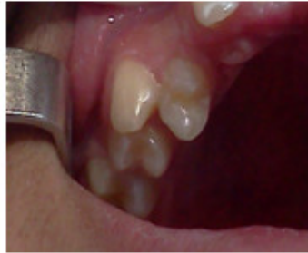
Fig. 3. Transposición del diente 13 con 14 y rotación del 14.