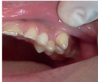
Fig. 4. Transposición del diente 23 con 24.

La radiografía periapical de ambas hemiarcadas (Fig. 5 y 6) evidenciaron la presencia de transposición tanto coronaria como radicular.