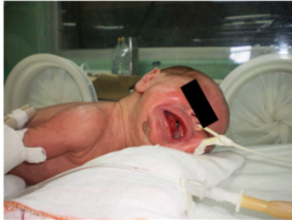
Fig. 2. Paciente después de la labio-glosopexia de Routledge.