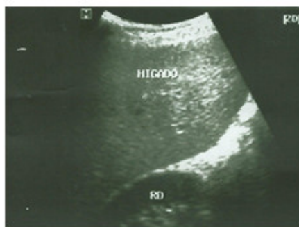
Fig. 3. Imagen ultrasonográfica del hígado.

Se realizó ultrasonido abdominal donde se corroboró la hepatomegalia detectada al examen físico, con un discreto aumento de la ecogenicidad hepática y pancreática, sin nódulos visibles ni otras masas tumorales, no adenopatías intrabdominales, ligera esplenomegalia, sin líquido libre en cavidad abdominal ni otras alteraciones ultrasonográficas en el resto de los órganos abdominales: Imagen ultrasonográfica del hígado (figura 3) y el bazo (figura 4).