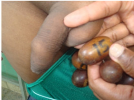
Fig. 1. Medición del volumen testicular.

impuso tratamiento con testosterona y gonadotropinacoriónica con discreta mejoría de sus síntomas. (Fig. 1)