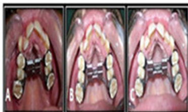
Fig. 2. Secuencia de evolución clínica.

convergencia marcada de las coronas de los incisivos y quedó eliminada la mordida cruzada posterior (figura 2 C).