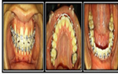
Fig. 4. Fase de finalización y detallado.