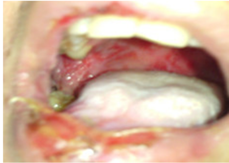
Fig. 2. Úlceras sangrantes y dolorosas de bordes irregulares en toda la mucosa.

Se detectaron múltiples adenopatías en ambos hemicuellos. En el examen intraoral se pudo constatar úlceras sangrantes, dolorosas, de bordes irregulares, mal definidos en toda la mucosa y con toma de las paredes faringeadas y extendidas a ambos labios. (Fig. 2 y 3)