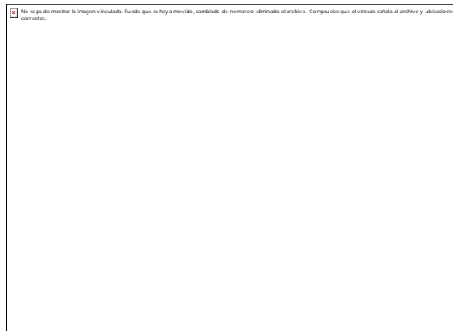
Fig. 4. Sarcoma de Kaposi asociado al VIH/sida. Manifestaciones cutáneas.