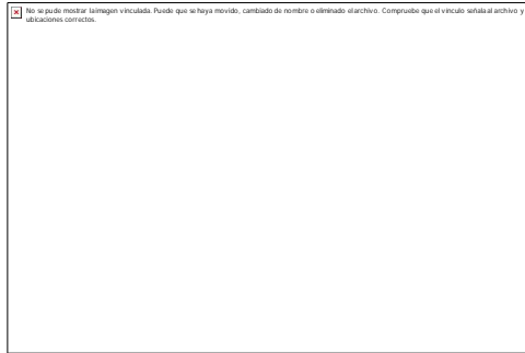
Fig. 1. Sarcoma de Kaposi y Condiloma acuminado orales asociados al VIH/sida.

-Mucosa anal: presencia de lesiones maceradas, húmedas y segregantes de bordes no definidos en región interglútea y anal, acompañadas de sensación de ardor. ( Fig. 2 )