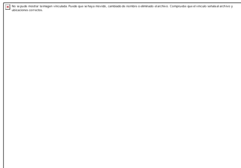
Fig. 2. Candidiasis interglútea y anal.

- Abdomen: suave, depresible no doloroso a la palpación presencia de hepatoesplenomegalia.