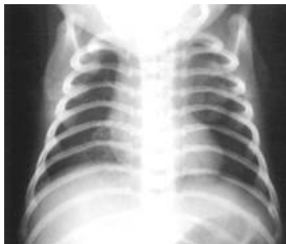
Fig. 2 ID: Recién nacido a término con peso elevado. Dificultad Respiratoria. Asfixia ligera del periparto. Enfermedad Quística Adenomatoidea.