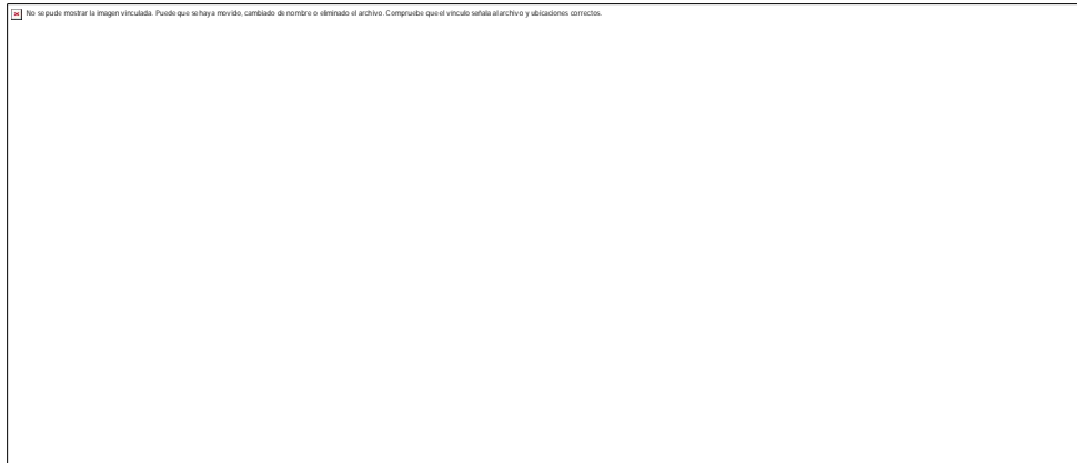
Fig. 5. Tomografía de coherencia óptica.