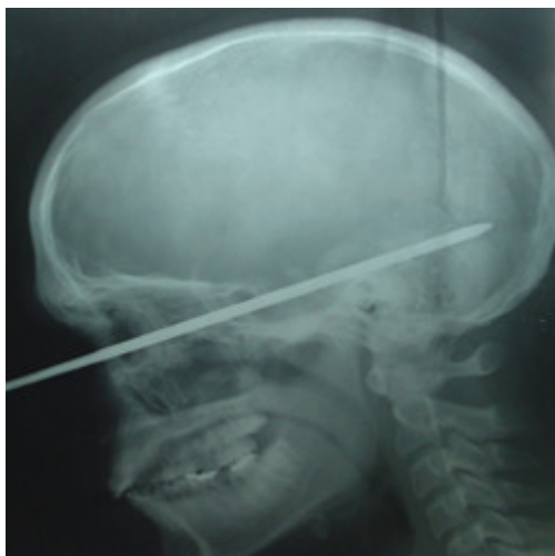
Fig. 1. Radiografía simple de cráneo. Vista sagital.