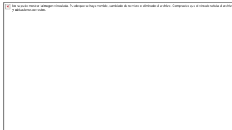
Fig. 1. Lesión inicial a nivel ungueal (onicodistrofia).

Al examen físico se observa un área de melanoniquia de 1,5 cm de ancho, con bordes irregulares bien definidos y coloración poco homogénea. Se observa a nivel periungueal un punteado muy difuso, denominado signo de Hutchinson. ( Fig. 1. )