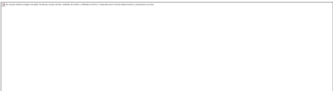
Fig. 3. Paciente a dos años de la intervención quirúrgica.

En la actualidad, el paciente no muestra datos de recurrencia. Dos años después de la intervención, se observa un excelente resultado estético y funcional, y se encuentra incorporado a la sociedad en su trabajo habitual. (Fig. 3.)