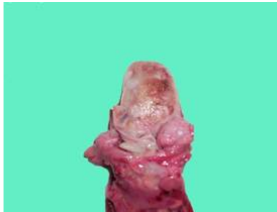
Figura # 1

Signos tanatológicos correspondientes con una data de muerte estimada entre 4 y 8 horas. Signos de violencia: Cianosis facial y distal, edema cerebral, en el interior de la laringe encontramos un condón de látex casi íntegro ocluyendo la luz del órgano (Figura # 1), tráquea y bronquios con abundante espuma blanquecina en su interior y edema pulmonar (Figura # 2), manchas asfícticas (Tardieu) en la superficie pleural. Sangre oscura y fluida.