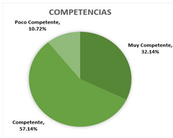
Gráf. Estado de competencias de los especialistas en cirugía general.

Como resultado del análisis de la evaluación realizada a la adecuación puesto-persona, se concluyó que la organización es competente. (Gráfico)