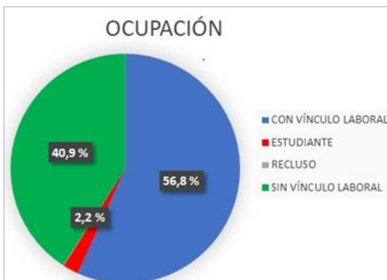
Fig. 3. Ocupación de los individuos fumadores.

En la figura 3 se observa la relación del hábito de fumar con la ocupación. El 56,8 % (646) se encuentra vinculado a un trabajo, el 40,9 % (465) no presenta vínculo laboral alguno, el 2,2 % (25) de los pacientes estudian, y hay un recluso en la comunidad que representa el 0,1 % de los fumadores.