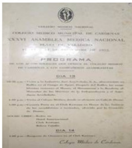
Fig. 9. Programa de los actos sociales que ofreció el Colegio Médico de Cárdenas en la XXXVI Asamblea Médica Nacional, 12 al 14 de diciembre de 1952.