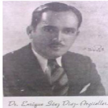
Fig. 6. Dr. Enrique Sáez Díaz-Argüelles. Médico y alcalde ilustre de la ciudad de Cárdenas.