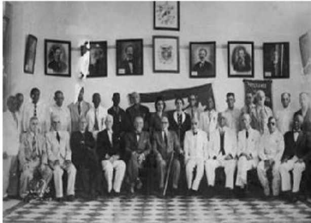
Fig. 3. Grupo de veteranos y sus hijos en el Centro de la Delegación de Cárdenas.