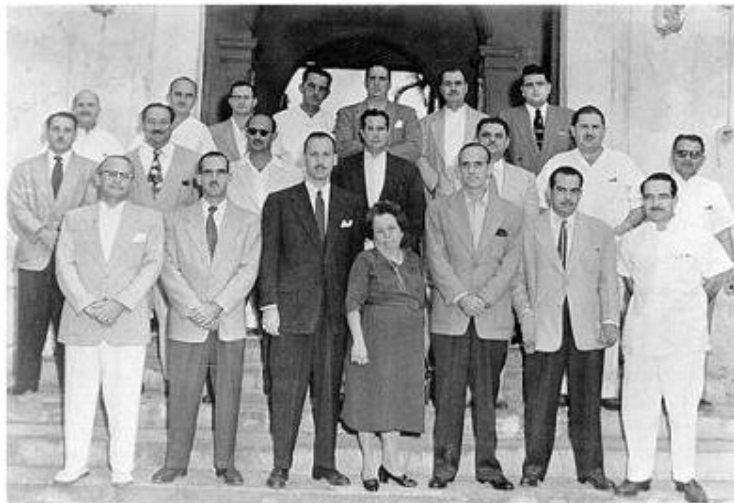
Fig. 8. Foto de la directiva del Colegio Médico de Cárdenas, 1957.