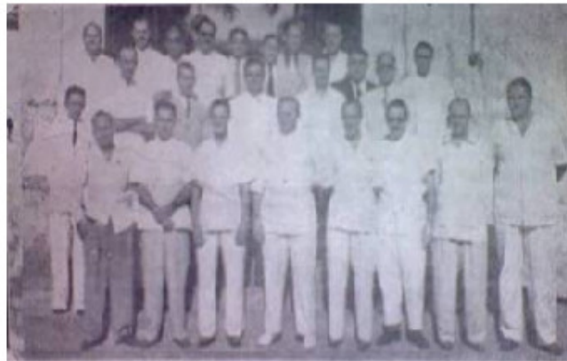
Fig. 7. Integrantes del Colegio Médico en el año 1948.