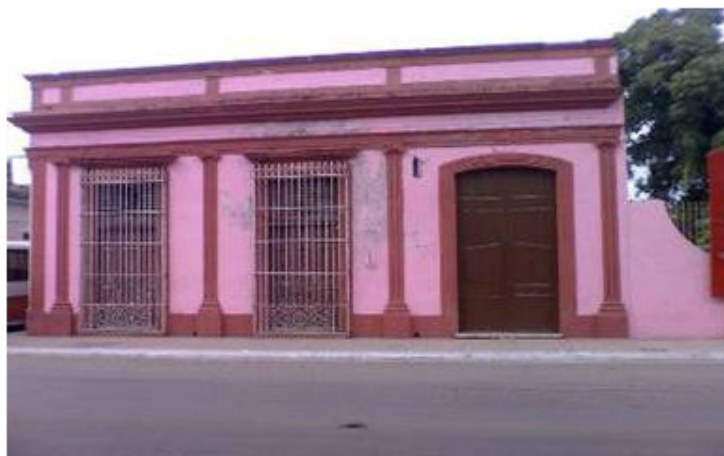
Fig. 10. Último local utilizado por el Colegio Médico de Cárdenas. Actualmente en el local se encuentra establecida la Dirección Municipal de Educación.

Anexo. Miembros del Colegio Médico de Cárdenas después del triunfo revolucionario cubano