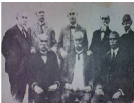
Fig. 1. Supervivientes del 27 de noviembre de 1871. Foto tomada en 1918.